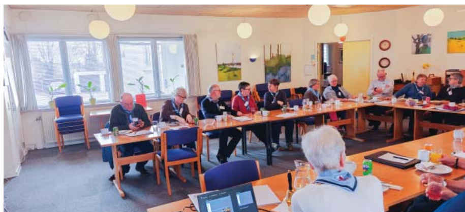
Deltagerne i Kolding sidder på spring til at komme i gang med gruppearbejdet.