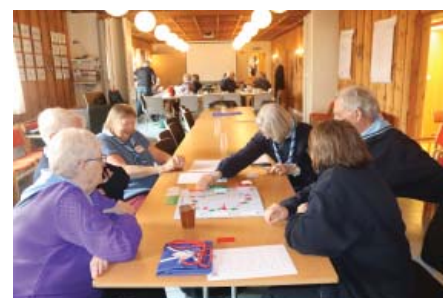
I Slagelse var der fuld gang i brætspillet

Du kan finde det fulde referat med alle de konkrete idéer fra møderne på hjemmesiden under Medlemsområde – Materialer – Inspirationsmaterialer .