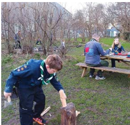
"Spejderne skal udfordre sig selv – og turde blive udfordret." Her er en junior i gang ved huggeblokken.

En af de grupper, der var med i 2025, er 12. Århus, en gruppe i den nordlige del af byen. Det gik godt i fjor både med tilgang af et par nye spejdere og en ny leder, så man er med igen i år.