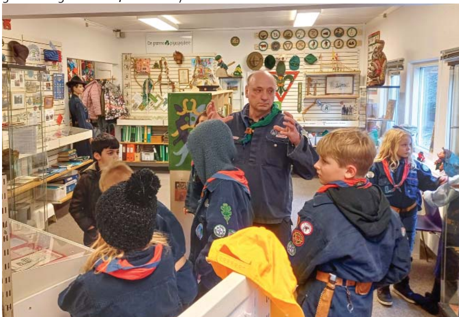
Allerede fra starten begyndte museet at få besøg af aktive spejdere. Her er det en gruppe juniorer fra Marselis-spejderne, der får en rundvisning.

Trods alt er der gode muligheder for at kikke indenfor, hvis man kommer i nærheden af et museum – og får en aftale.