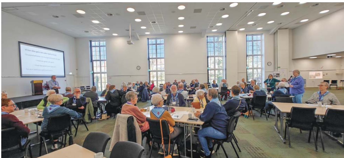
Så er der spørgetime.

Selvom engagementet er stort lokalt, er der opgaver, der løses bedst i fællesskab. Fra grupperne var der et ønske om en mere professionel tilgang til markedsføring og analyse.