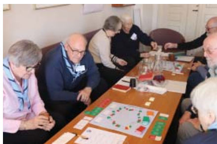
I Aalborg var der også fuld gang i brætspillet