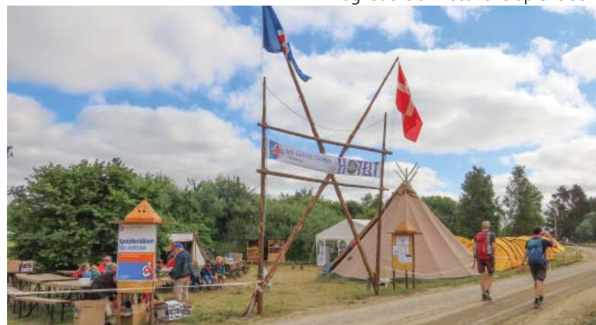
Indgangen til Hotelt 2022.

Som altid er der "åben teltdør" på Hotelt. Har du brug for et hvil, en god snak eller en kop varm kaffe, så kig forbi. Vi er en del af fællesskabet – og vi glæder os til at se dig!