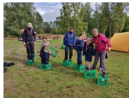
1. Silkeborg gruppe er med for første gang. Gruppen har sendt dette foto med en af de aktiviteter, der måske kommer med.

hjemmeside. Han tilføjer, at det ikke handler om at nå et bestemt mål, "men om at man gør sit bedste. Det er kernen i, hvorfor det er sjovt at være med – og hvorfor fællesskabet er vigtigt. Det tror jeg giver den ranke ryg og selvtilliden."