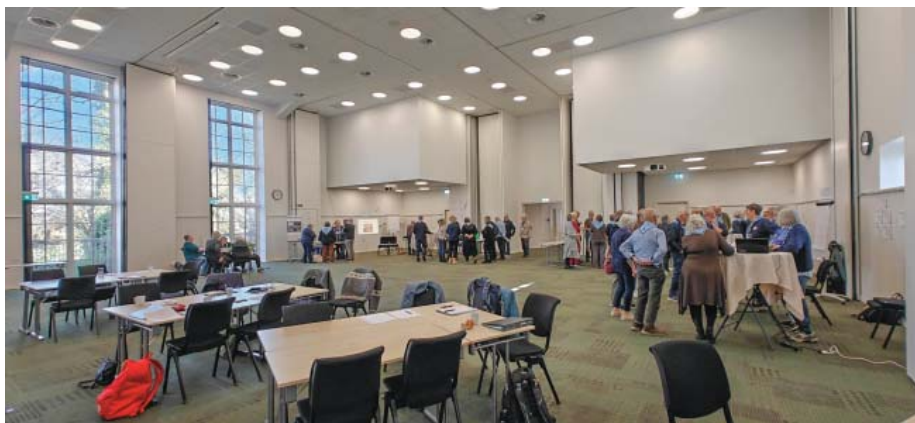
De faste udvalg og landsgildeledelsens medlemmer i dialog med deltagerne.

Denne artikel har landsgildeledelsen bragt et svar på, og da redaktionen mener at det vil være af stor interesse for alle gildeledelser rundt om i landet at