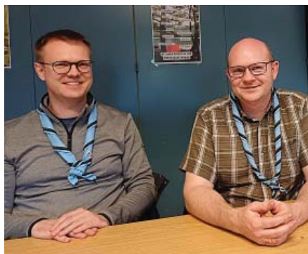
De "Unge ledere".