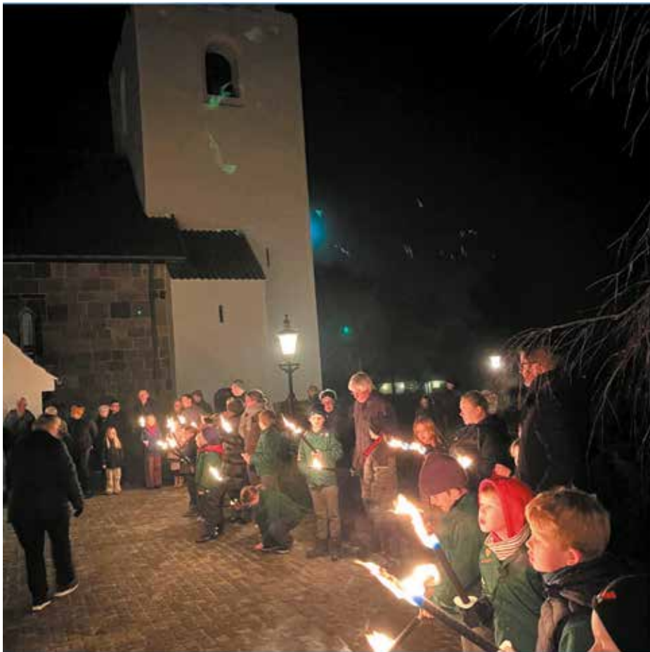
Spejdere med fredslysfakler foran Gjellerup Kirke.