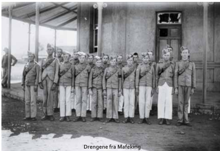
Drengene fra Mafeking