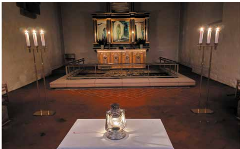
Fredslyset i Gjellerup Kirke

“Det kan aldrig skade at tænde et lys!” Sådan fortalte en ældre præst engang,