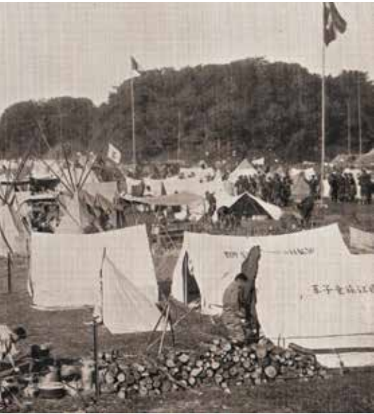
den med deltagelse fra 34 lande

har vi samlet det, vi kalder Spejdermetoden. Elementerne er ikke en vælg-selv buffet, men en helhed. Alle skal indgå i spejder- og gildelivet.