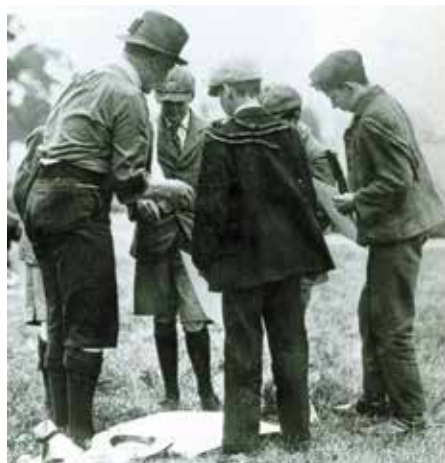
Baden-Powell instruerer en flok drenge på Brownsea Island

Lejren blev en stor succes. Spejderbevægelsen var født.