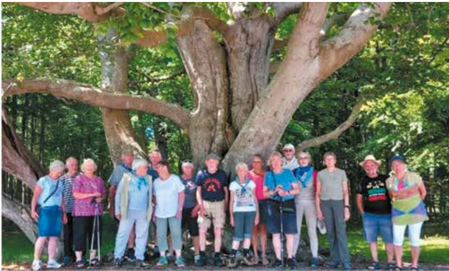
Naturlaug Fyn på udflugt.

2. februar er kyndelmisse. Dagen ligger lige mellem vintersolhverv og forårsjævndøgn. I gamle dage sagde man, at der var lunt vejr på vej, hvis lærken hørtes på kyndelmisse, eller at solskin på Kyndelmisse varslede frost og sne..