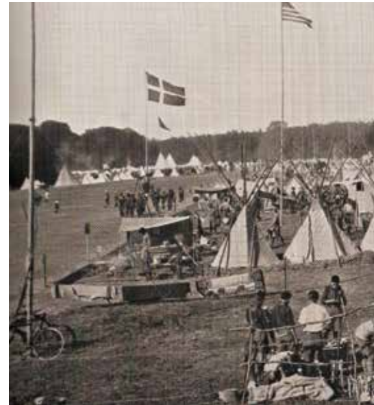
Den anden verdensjamboree blev afholdt i Ermelunden

Men spejderidéen? Hvordan kan man beskrive den? Spejderbevægelsens mål har fra starten været at udvikle selvstændige og selvhjulpne mennesker, der aktivt og hjælpsomt kan deltage og tage ansvar i fællesskabet.