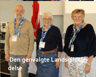
Den genvælte Landsgildede