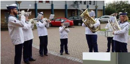
Skælskør Marinegarde tog imod.