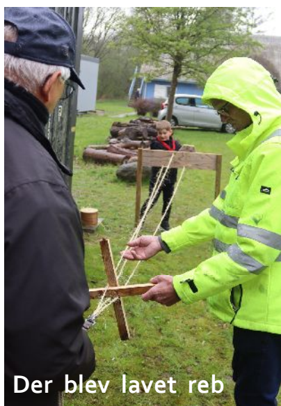
Der blev lavet reb

Der var en rigtig god stemning og alle gik i gang med de forskellige aktiviteter.