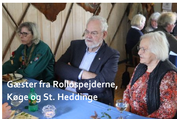
Gæster fra Rollospejderne, Køge og St. Heddinge