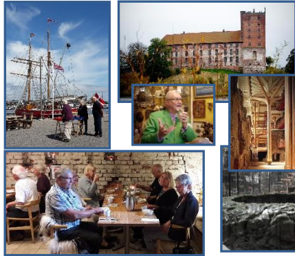
Sommertur til Koldinghus d. 14. juni 2017