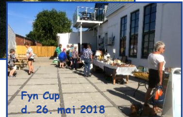
Fyn Cup d. 26. mai 2018