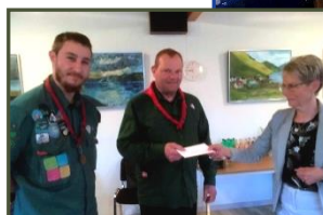
Sct. Georgs Aften d. 24. april 2018