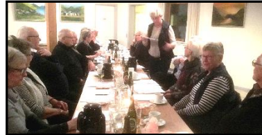
Gildeting d. 14. marts 2018