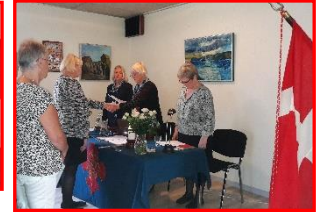
Gildehal d. 18. sept. 2017