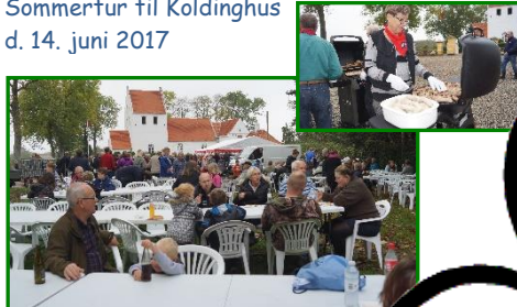
Traveturen d. 15. oktober 2017