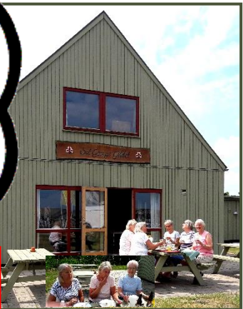
Heksegruppen d. 28. maj 2018