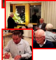
Nytårs- gildehal 9. januar 2018